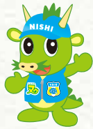
さいたま市PRキャラクター つなが竜スッ